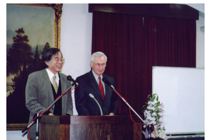
エリクソン来日講演会：K B I 旧校舎にて

り、また世界の福音派のスタンダードたる「組織神学書」として高い評価を受けています『キリスト教神学』を購入していただき、また難しいと思われる方は「誰にでも分かる『キリスト教神学』DVD講義録全集」を個人ないし教会で購入していただき、継続的に学んでいただき、聖書解釈においても、神学形成においても、JECがますます尊敬されてやまない高貴な群れとして成長させられていくことを願っています。